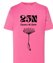
IMPRESIÓN DELANTE EN NEGRO 11,8x25 cm

Todos los beneficios de las camisetas van destinados a la casa de acogida de mujeres víctimas de violencia de género del ONG Mensajeros de Paz.