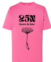
IMPRESIÓN DELANTE EN NEGRO 11,8x25 cm

Todos los beneficios de las camisetas van destinados a la casa de acogida de mujeres víctimas de violencia de género del ONG Mensajeros de Paz.