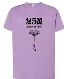
IMPRESIÓN DELANTE EN NEGRO 11,8x25 cm

Como sabéis, hemos encargado camisetas. Hay que venir en lunes con ella. Si habéis decidido no adquirirla, os pedimos que vuestras hijas e hijos vengan con una camiseta de la tonalidad que hemos elegido (lila, violeta, rosa) o en su defecto blanca.