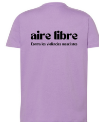
IMPRESIÓN DETRÁS EN NEGRO 31x9,8 cm

Todos los beneficios de las camisetas van destinados a la casa de acogida de mujeres víctimas de violencia de género del ONG Mensajeros de Paz.