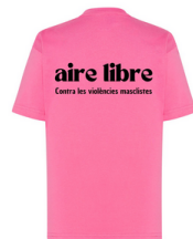
IMPRESIÓN DETRÁS EN NEGRO 19x6 cm

Las tallas más pequeñas se han tenido que hacer en este color por falta de disponibilidad de la empresa.