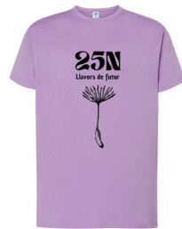
IMPRESIÓN DELANTE EN NEGRO 11,8x25 cm

Como sabéis, hemos encargado camisetas. Hay que venir en lunes con ella. Si habéis decidido no adquirirla, os pedimos que vuestras hijas e hijos vengan con una camiseta de la tonalidad que hemos elegido (lila, violeta, rosa) o en su defecto blanca.