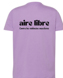
IMPRESIÓN DETRÁS EN NEGRO 31x9,8 cm

Todos los beneficios de las camisetas van destinados a la casa de acogida de mujeres víctimas de violencia de género del ONG Mensajeros de Paz.