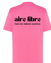
IMPRESIÓN DETRÁS EN NEGRO 19x6 cm

Las tallas más pequeñas se han tenido que hacer en este color por falta de disponibilidad de la empresa.