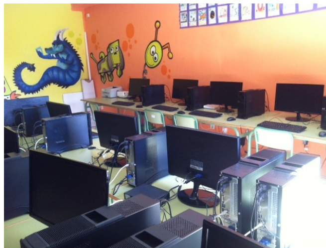
Sala de ordenadores de EP

Además tenemos tablets y ordenadores portátiles para uso del alumnado.