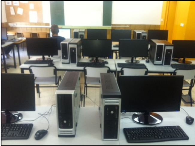
Sala de ordenadores de ESO

También contamos con dos aulas de informática. Una con veintitrés ordenadores y otra con quince.